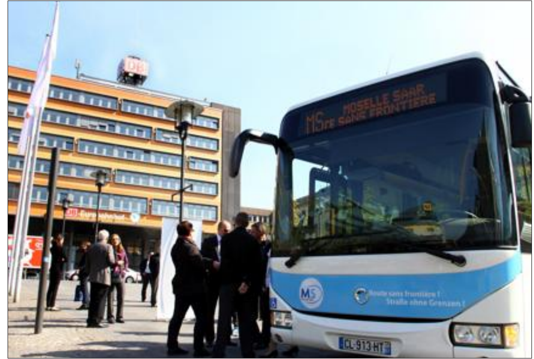
Au départ de la gare routière de Sarrebruck (notre photo), il faut compter une heure pour relier Saint-Avold avec les bus MS via toute la vallée de la Rosselle. Il y a entre douze et quatorze arrêts côté français et jusqu'à huit côté sarrois.