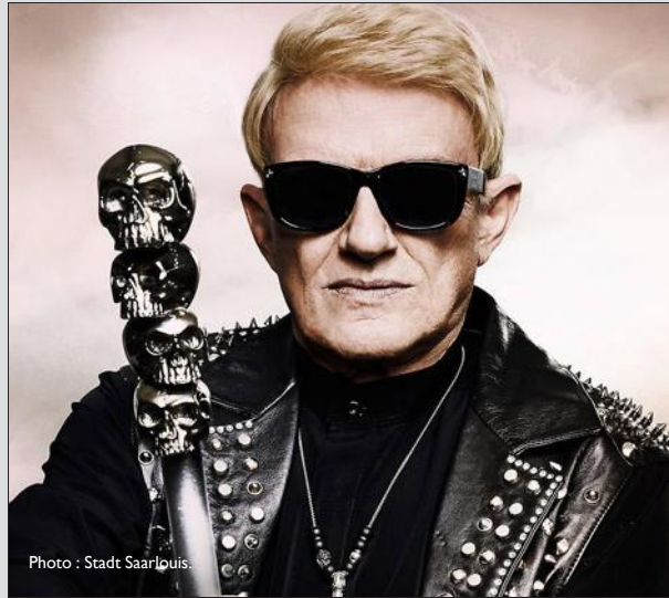
Heino, 76 ans, l'inusable chanteur de Volksmusik, sera la vedette du vendredi soir. Pour l'occasion, il entend renouveler son répertoire avec des incursions dans le rock et la pop.

À partir de ce soir, le centre-ville de SarreloUIS se transforme en immense place des fêtes. Jusqu'à samedi, quatre podiums d'animations et une multitude de stands de restauration font de la ville fortifiée par Vauban le centre d'attraction n° 1 de la Sarre pendant trois jours. Aujourd'hui étant jour férié en Sarre (Fête-Dieu), les festivités sont lancées dès la fin de l'après-midi par une Zumba-Party. Les points forts de l'animation musicale se situent vendredi et samedi grâce notamment aux podiums de vedettes installés par la Radio sarroise. En tête d'affiche vendredi, Heino, le chanteur populaire aux éternelles lunettes noires sous une chevelure blonde comme les blés. Adulé par les uns, honni par les autres, Heino (Heinz Georg Kramm), 76 ans, s'est fait le chantre de la Volksmusik et des "Schlager". Les autres stars de la Emmes voguent sur des genres musicaux bien différents, du rock au reggae, de l'italo-pop au rap. Les concours nationaux du style "Nouvelle Star" alimentent également les affiches avec bonheur.