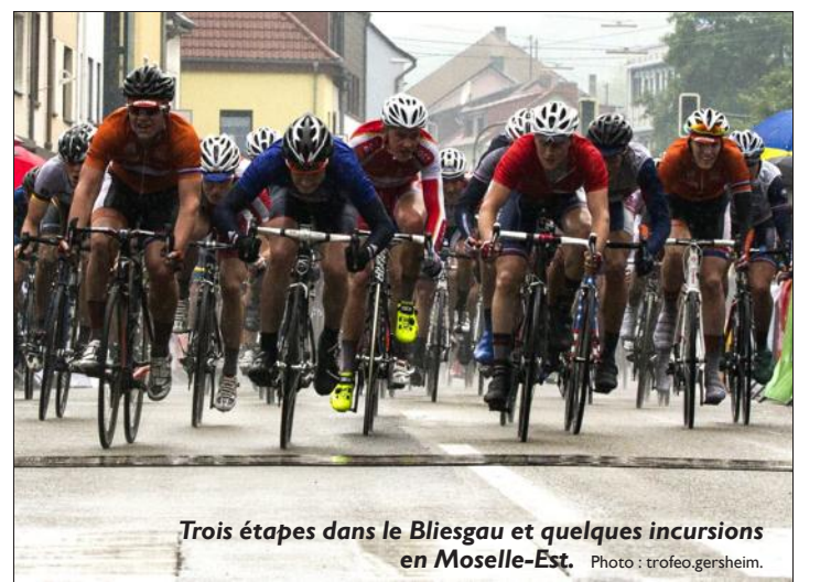
Trois étapes dans le Bliessgau et quelques incursions en Moselle-Est.

Dix-huit équipes nationales juniors d'Europe, d'Asie et d'Amérique prendront le départ vendredi dans le Bliessgau avec des incursions en Moselle-Est à Frauenberg, Bliedheim, Bliedheim, Obergaibach et Rimling.