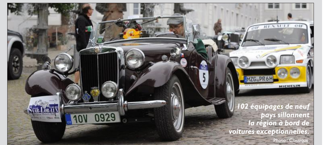
102 équipages de neuf pays sillonnent la région à bord de voitures exceptionnelles.

Une balade de 500 km à 30 km/h à travers la Sarre, le Luxembourg et la Moselle : le 17 e rallye Saar-Lor-Lux Classique se présente comme une belle parade des amateurs de voitures de collection. 102 équipages (nouveau record) venant de neuf pays européens et des États-Unis prendront le départ à bord de voitures de 30 marques différentes. Parmi elles, des raretés comme la Wolseley Hornet, Allard, la Chevrolet Buiness Coupe, l'Aero, la Lancia Aprila. Le plus ancien véhicule est une Studebaker ED 6 de 1916. Le rallye Saar-Lor-Lux Classique n'est pas une course mais une épreuve de régularité où selon les catégories de voitures plus ou moins anciennes et selon les participants (experts ou débutants) les distances varient de 400 à 550 km tout comme les vitesses moyennes imposées (de 30 à 50 km/h) sur des étapes de 30 à 40 km. Si Sarrebruck constitue le point central des départs et arrivées, le 17 e rallye rend visite à