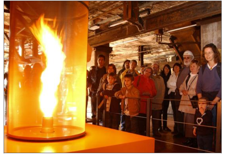
La Völklinger Hütte ouvrira ses portes gratuitement aux visiteurs présentant le programme du Warndt Week-end à la caisse. Dimanche, journée du patrimoine culturel mondial de l'Unesco, des visites guidées gratuites y sont organisées, notamment dans l'espace éducatif ScienceCenter Ferroddrom®.

Le Warndt, cette région verte à laquelle l'immense forêt franco-allemande a donné son nom, montre toute sa diversité lors de la 15 e fête transfrontalière qui commence aujourd'hui. Parmi les 56 manifestations réunies sous le thème du Warndt Week-end, de part et d'autre de la frontière, la nature jouera un rôle de premier plan et offrira des randonnées et des découvertes. Cependant, la culture industrielle sera également omniprésente et proposera notamment des visites gratuites de la Völklinger Hütte, de la mine-école de Velsen ou encore le musée du verre de Ludweiler.