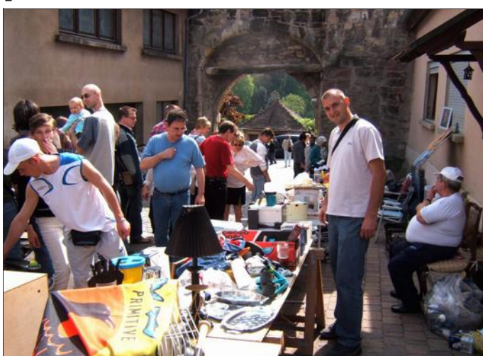
Le vide-grenier dans les rues du Vieux-Hombourg dimanche est toujours prisé.