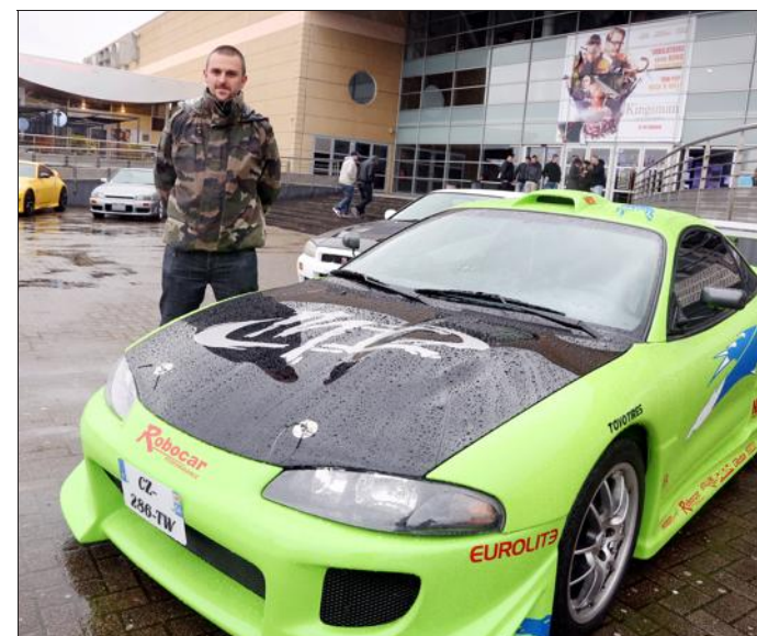
L'an dernier, les bolides de la team JDM étaient déjà de sortie devant le Kinopolis de Saint-Julien-lès-Metz.