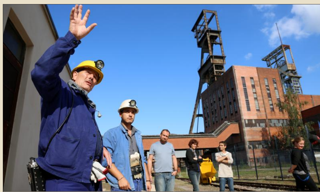
Le musée Les Mineurs accueillera le public ce dimanche, de 9 h à 18 h.