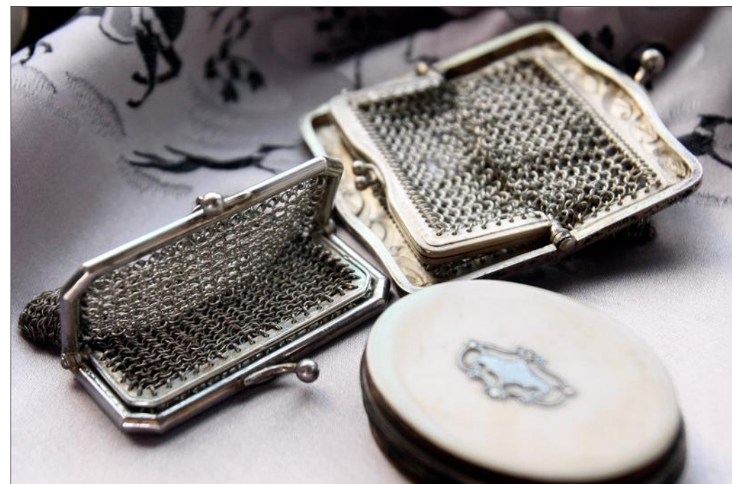
Un poudrier nacré et deux porte-monnaie en mailles métalliques figurent parmi près de 120 pièces présentées au public.

Le 20 mars à 20 h, une conférence est organisée et permettra au public de rencontrer M. Rondio. Lors de cette conférence, il évoquera : la création