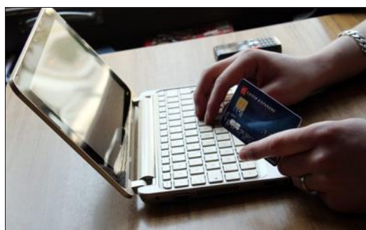
Après un achat sur le web, le vendeur est tenu de préciser la date de livraison du bien.

Une habitante de Creutzwald a passé commande par Internet, en décembre 2013, d'une étagère pour un montant de 308,99 € sur le site "Docteurdiscount.com", réglée par carte bancaire. Le délai annoncé de préparation de la commande devait être de dix à douze jours et la livraison devait être effectuée deux à quatre jours plus tard. N'ayant reçu aucune livraison à la date prévue, la cliente envoie un premier courriel au vendeur qui, en réponse, s'engage à communiquer rapidement une date de livraison. Cette promesse ne sera pas tenue. La cliente demande le remboursement du montant réglé. Docteurdiscount.com fait état de problèmes logistiques et assure une livraison prochaine. N'ayant aucune autre nouvelle, sur les conseils de l'UFC Que Choisir de Moselle-Est, la Creutzwaldoise envoie à UP Trade, gestionnaire du site, un courrier en RAR (recommandé avec accusé de réception) par lequel elle demande sans délai le remboursement. Pas de réponse. L'UFC Que Choisir de Moselle-Est adresse un courrier au gestionnaire en mai 2014 lui rappelant ses obligations. L'adhérente a fini par obtenir l'annulation de la commande et le remboursement de 308,99 €.