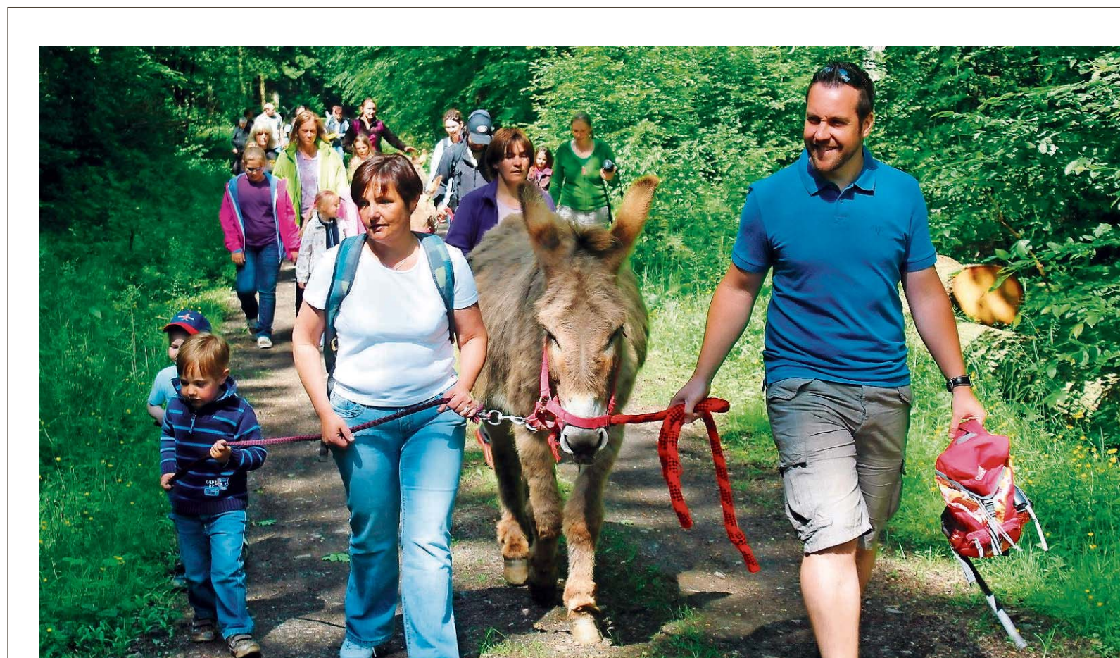
Wanderung stehen auch bei der 15. Auflage des Warndt Weekends hoch im Kurs. Mit dem Verein Maltiz geht es auf Tour, zu anderen sollte man am besten mit leerem Magen anreisen, zu den so genannten Genusswanderungen.

Sein Kommentar galt auch dem Lob des Evaluators Olaf Kühne für die hervorragenden Bewer-