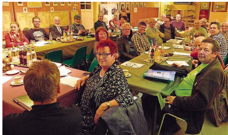
In einer gemeinsamen Sitzung haben Eurodistrict und Weekend-Partner das Programm verabschiedet.