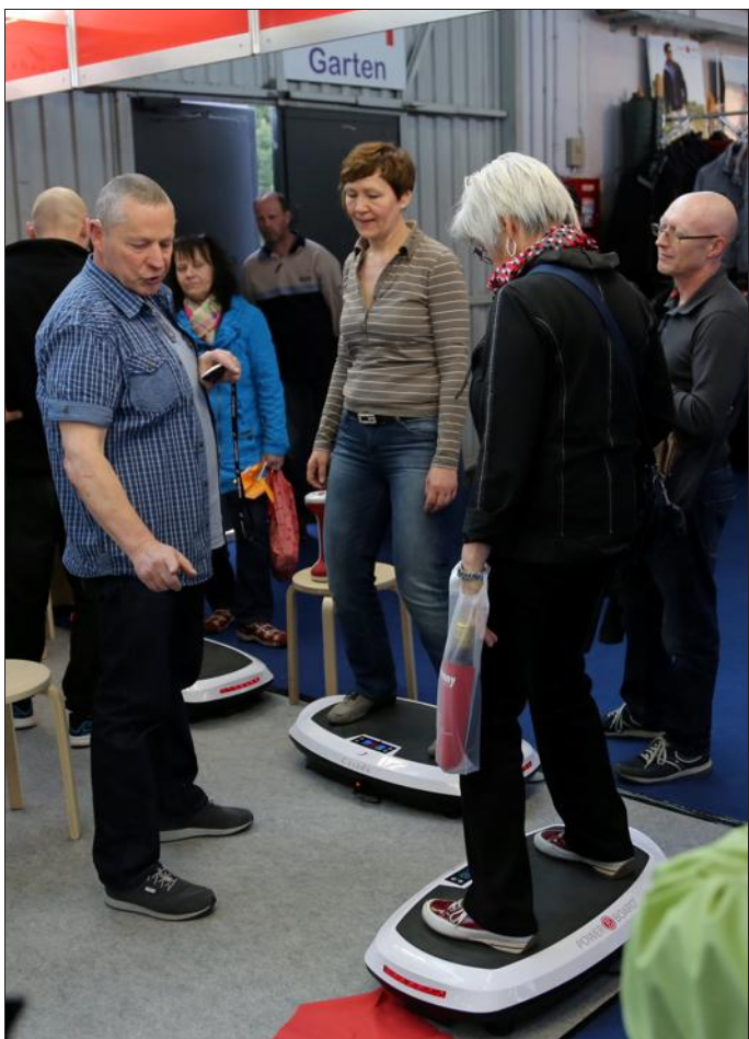
Les visiteurs étaient au rendez-vous pour le premier week-end d'ouverture de la Saarmesse.

La Foire internationale de la Sarre (Saarmesse) a ouvert ses portes samedi au parc des expositions de Sarrebruck. Le premier week-end est plutôt réussi, puisque la manifestation enregistre une hausse de la fréquentation de près de 15 % par rapport à l'an dernier.