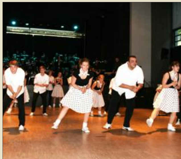
Danse et musique se sont succédé à un rythme d'enfer.

Le 12 e Warndt Weekend ayant pris son envol mercredi soir, du côté du Musée de la Mine, aura maintenant atteint sa vitesse de croisière, avec ses nombreuses manifestations des deux côtés de la frontière.