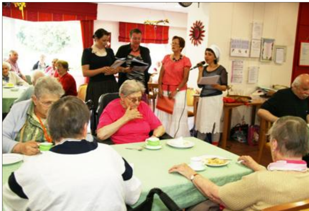
Les résidents des "Peupliers" ont passé un excellent moment, au "contact" de la lecture, au travers de contes et autres chansons lues.

Légendes botaniques, usages culinaires et savoirs populaires de ces herbes "folles" seront révélés pour l'occasion. Une approche sensorielle et ludique, par la poésie des histoires et par la magie des croyances et des mythes. Avis aux amateurs !