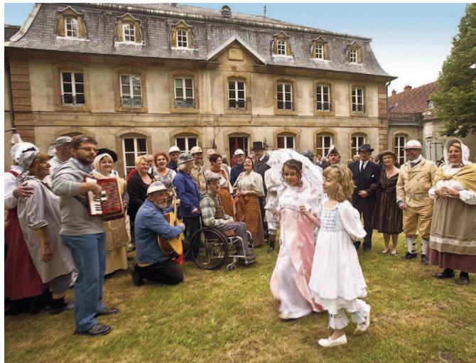
Auch das lothringische Homburg-Haut ist wieder Schauplatz des Warndt-Weekend. Im vorigen Jahr läuteten dort die „Kinder der Kohle“ das grenzüberschreitende Wochenende ein.