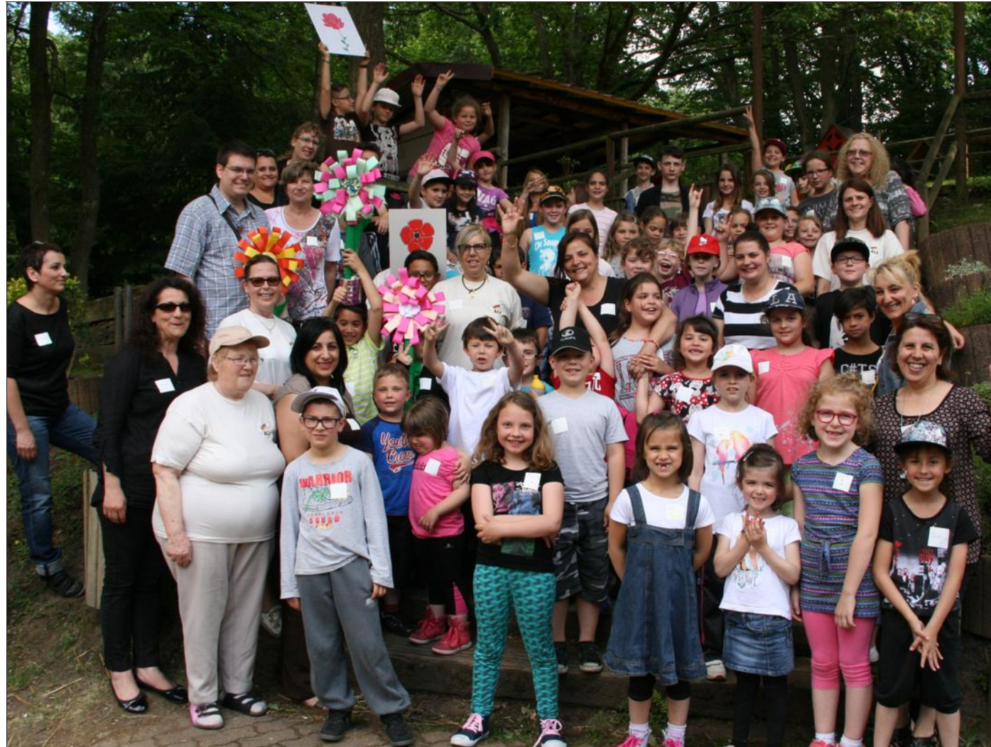
La bonne humeur était de mise mercredi au chalet des Amis de la nature, dans la vallée du Schafbach à Petite-Rosselle.

Ce rassemblement, avec plus de 70 participants et 15 animatrices, était aussi l'occasion pour les enfants des différents clubs des alentours, de faire connaissance. Une après-midi qui s'est déroulée dans la joie et la bonne humeur, à l'approche des vacances. « L'ACE ne s'arrête pas pour autant en