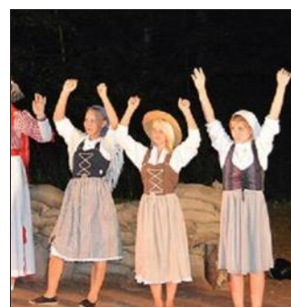
Chaque année, entre 30 et 40 comédiens participent au spectacle.

Chaque été, en forêt de Butten, entre Soucht et Sarre-Union, les "Nuits de mystère" constituent un spectacle en plein air original et grand public. Le thème change à chaque fois, et concerne une période historique donnée. Ce spectacle fait toujours appel à des bénévoles, et demande d'être disponible pour six représentations nocturnes entre le 1 er août et le 14 août. Les répétitions débutent fin avril, et ont lieu généralement le soir ou le week-end pour permettre à ceux qui travaillent de se joindre à l'aventure. Tous les âges sont possibles pour être candidat à ce spectacle, et la première rencontre doit avoir lieu le 19 avril. Une réunion de démarrage est programmée le vendredi 10 avril. Toute personne intéressée peut se faire connaître auprès de Anne Buda, chargée de la culture auprès de la Communauté de communes d'Alsace Bossue. Contact : 03 88 01 21 12 ou anne.buda@cc-alsace-bosue.net