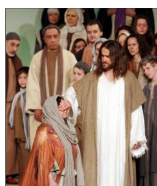
Jésus rend la vue à une femme aveugle.

A 10 km de Sarreguemines, la troupe du Petit théâtre d'Auersmacher présente les Jeux de la Passion retraçant la vie et la mort de Jésus-Christ. D'ici fin avril, 6 représentations mettront encore en scène pas moins de 80 comédiens dont 30 dans les rôles principaux. 300 bénévoles (organisation, intendance, costumes, technique, masques, lumières...) sont mobilisés autour de cette œuvre collective. L'une des particularités de cette Passion d'Auersmacher réside dans le fait que chaque premier rôle est doublé ce qui permet d'assurer une rotation entre les acteurs. Voici les dates des prochains spectacles : samedis 11, 18 et 25 avril à 15 et 19 h. Dimanches 12, 19 et 26 avril à 11 h et 15 h. Le lieu : Ruppertshofsaal d'Auersmacher au cœur du village. Accessible par la route direction Kleinblittersdorf en venant de Forbach et direction Sarrebruck en venant de Sarreguemines. Le tarif : 22 € et 11 € pour les enfants jusqu'à 14 ans. Réservations : du lundi au vendredi de 9 h à 12 h et de 14 à 18 h au 0049 6805 - 912544 ou 0049 6805 - 912545.