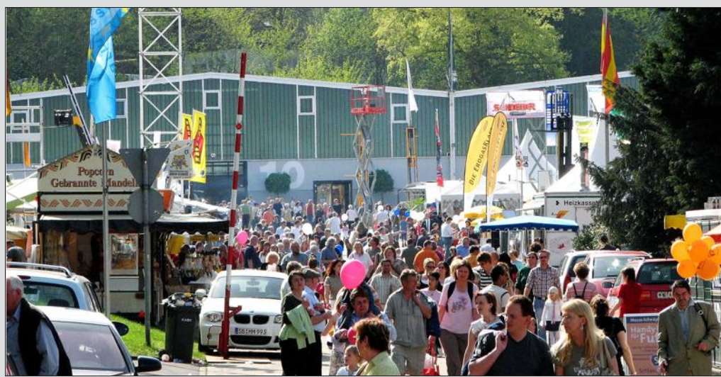
La foire-exposition spécialisée dans les domaines de l'habitat, le jardin, la rénovation présentera en plus cette année un salon automobile.