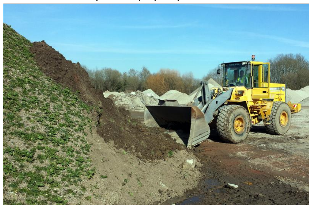
Sur la plateforme de Farébersviller, comme à Sarreguemines, TPHM recycle les produits issus de différents chantiers. Du béton à la terre végétale. Pour les pros, mais aussi pour les particuliers.

Mais si la société réutilise ses propres « déchets », et qu'elle les vend à d'autres entrepreneurs, elle accueille aussi des particuliers, sur ses sites de Sarreguemines et Farébersviller. « Le béton n'est plus utilisé pour sa destination initiale. On ne peut pas monter un mur avec... » Par contre, souvent, les citoyens viennent chercher quelques centaines de kilos