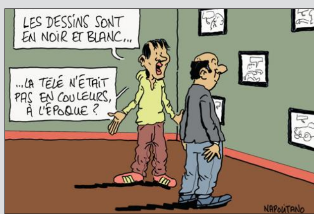
Des dessins de presse originaux de Napolitano, que l'on pourra acquérir, seront exposés chez Emmaüs.

Ce 6 avril, lundi de Pâques, Emmaüs Forbach organise deux manifestations. Dans la salle des ventes au 34, rue du Rempart à Forbach, vente spéciale de fleurs, plantes et jardinage, de 10 h à 12 h et de 14 h à 18 h. Des objets, parfois usuels, parfois insolites, en porcelaine, en terre cuite, en papier, en carton, en plastique, seront détournés, mis en scène et deviendront pots de plantes et fleurs ou vases à fleurs. Aux côtés de ces végétaux, Emmaüs propose aussi à la vente des outils, des livres, et tous articles relatifs au jardinage, aux plantations et à la nature.