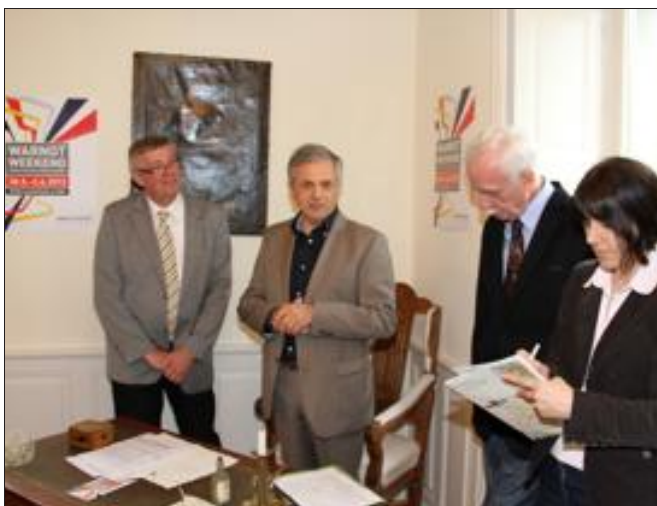
Les partenaires se sont retrouvés jeudi à Karlsbrunn pour dévoiler le programme.

La 13 e édition du Warndt Weekend est prête à être lancée. Le programme a été dévoilé jeudi par les partenaires français et allemands de cette grande manifestation organisée des deux côtés de la frontière. Rendez-vous du 30 mai au 2 juin pour 80 manifestations.