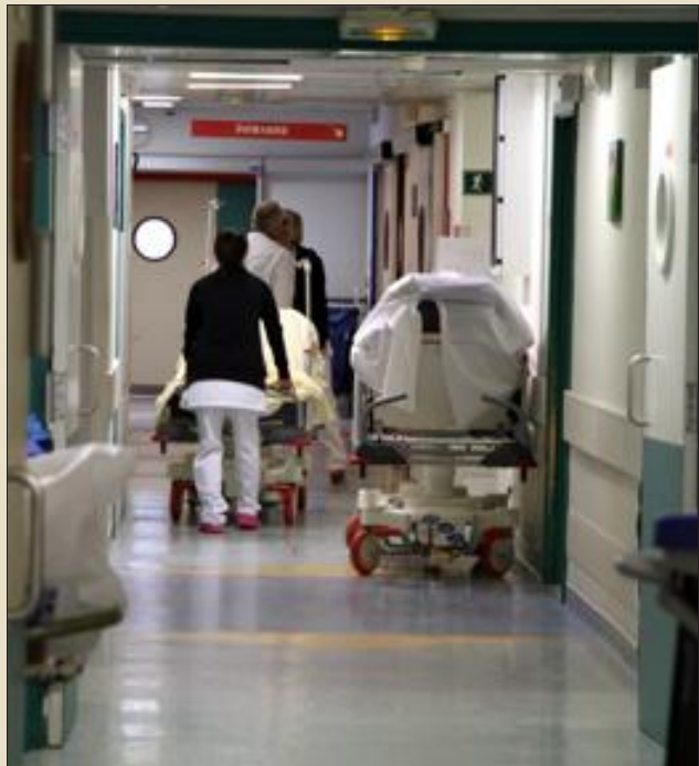
Le ton monte entre certains élus du Bassin houiller sur le dossier épineux de l'offre de soins en Moselle-Est.

Des syndicats ont décidé, jeudi soir, lors d'une réunion à Forbach, de lancer une pétition afin de réclamer le maintien de tous les emplois menacés dans les hôpitaux du secteur, y compris les CDD. Pendant ce temps, le ton monte entre certains élus qui s'accusent mutuellement des échecs passés et du fiasco du projet de construction d'hôpital neuf (PTU). Pas très rassurant à l'heure où l'agence régionale de santé de Lorraine s'appête à faire des annonces importantes sur le schéma sanitaire de l'Est mosellan.