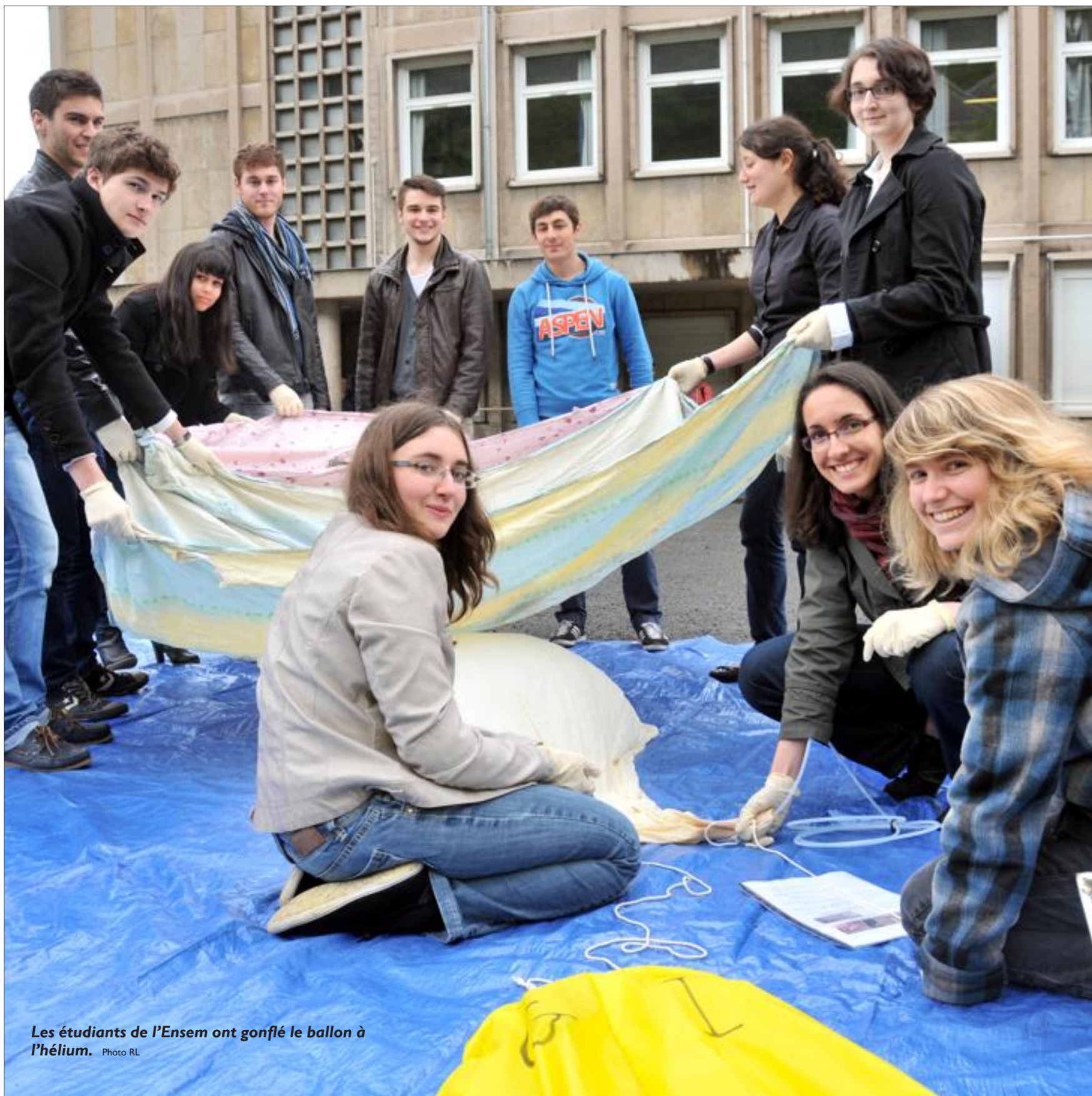
Les étudiants de l'Ensem ont gonflé le ballon à l'hélium.

Dans le cadre des Cordées de la réussite, un partenariat a été noué entre École nationale supérieure d'électricité et de mécanique de Nancy et le lycée Jean-Moulin de Forbach. Hier, une expérience grandeur nature a vu un ballon-sonde décoller depuis la cour de l'établissement. Une fois que l'enveloppe aura explosé, les étudiants devraient pouvoir le récupérer aujourd'hui.