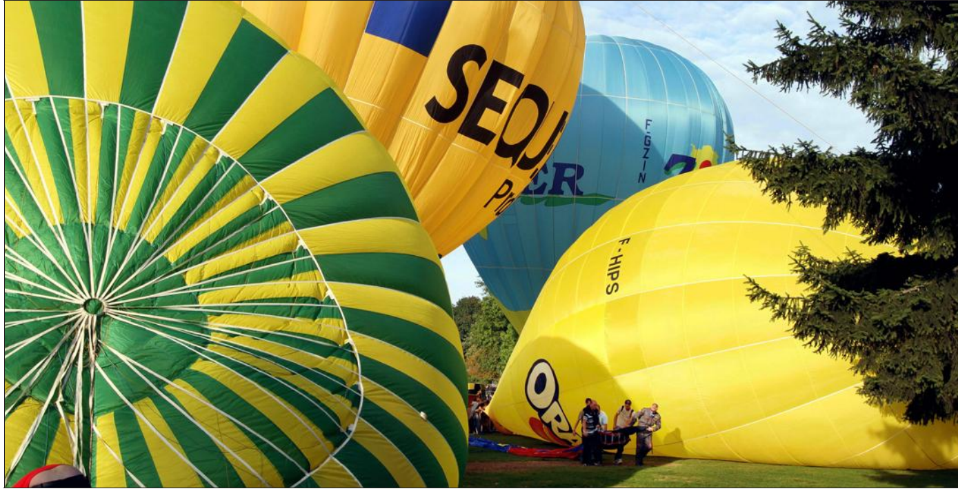
Des montgolfières de mille et une couleurs ont investi les abords du plan d'eau à Metz.