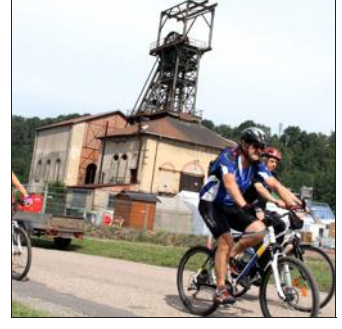
La manifestation cycliste transfrontalière se déroulera dimanche de 10h à 18h, au Parc Explor à Petite-Rosselle.

La manifestation populaire du Vélo Saar Moselle fêtera dimanche son 15 e anniversaire, sur le thème «70 années de paix et d'amitié». En effet, les intercommunalités franco-allemandes de la région ainsi que les nombreuses associations participantes sont à l'initiative de cet événement cycliste transfrontalier, qui aura lieu de 10h à 18h, au Parc Explor à Petite-Rosselle. Cette fête est destinée à tous, petits et grands, cyclistes débutants ou entraînés, chacun trouvera son bonheur parmi les différents parcours proposés! Le groupe musical Sarbruck Libre, des spécialités culinaires régionales, des informations