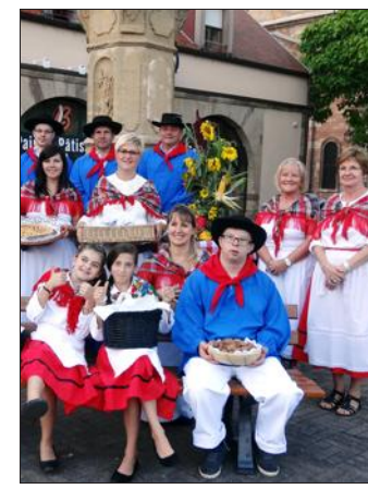
Les récoltes sont apportées en costume traditionnel.