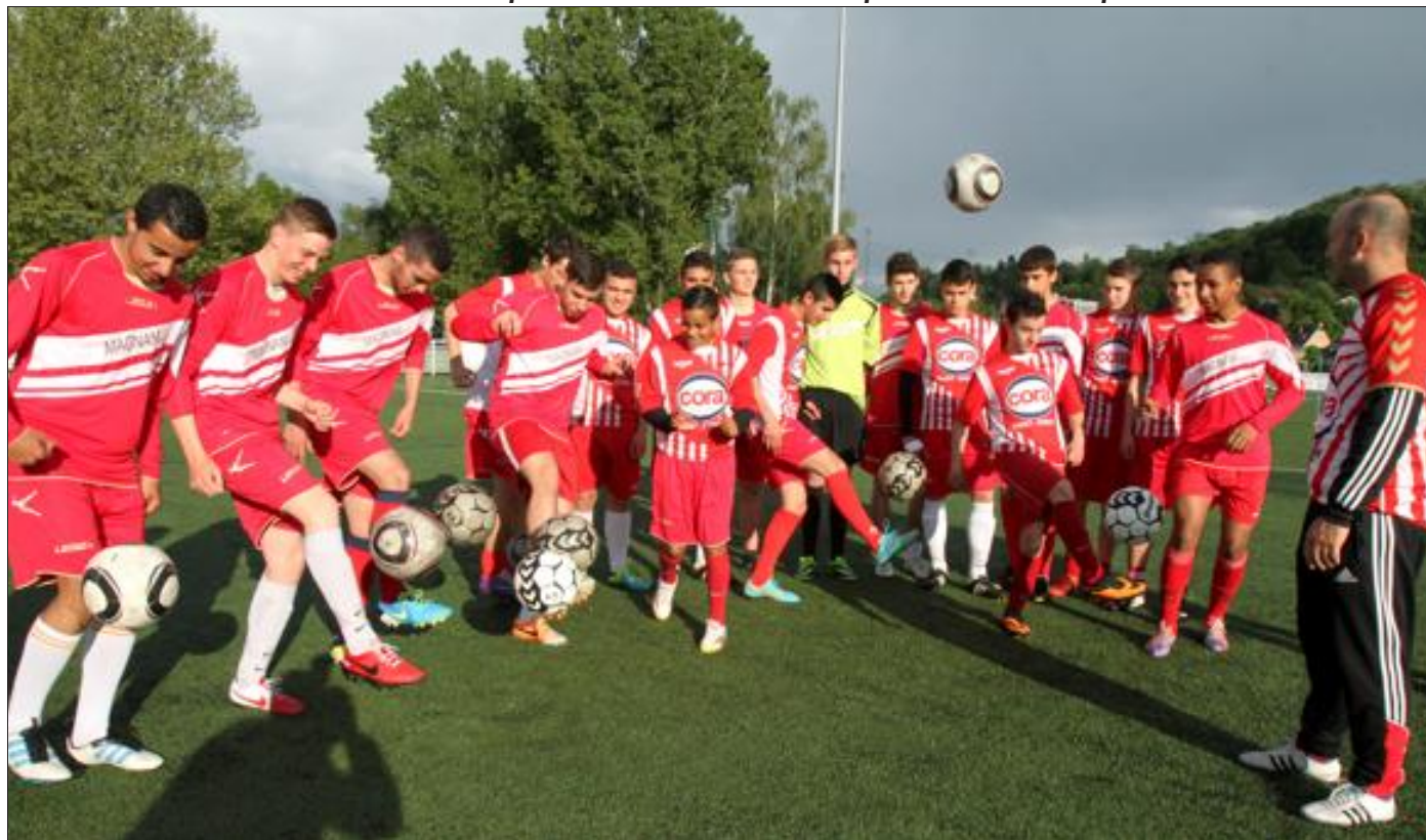
La mairie de Saint-Avold a assuré qu'une subvention permettrait d'assurer les déplacements dans tout le quart Est de la France. Mais pour le président l'heure est au recrutement. Le temps presse et il lance un appel.

Ainsi, sept éléments passent en senior à la rentrée (par choix du club, il n'y a pas de catégorie U 19), dont quatre pièces maîtresses : un attaquant, un libéro, un gardien et un milieu défensif.