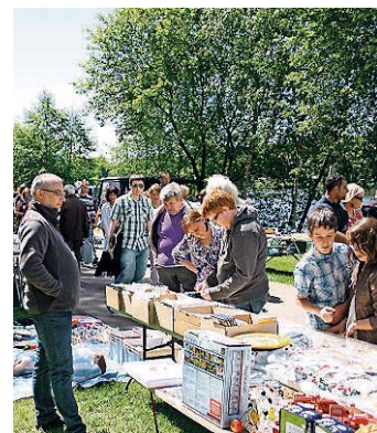
In Creutzwald darf beim Flohmarkt am See gestöbert werden.

Andere Angebote versprechen derweil hautnahe Begegnungen mit der Natur. Dazu gehören unter anderem eine geführte Wanderung auf dem „Warndt-Wald-Weg“, eine Besichtigung des Birkenhofs in Nassweiler sowie der Bienenlehrpfad in Geislautern. Auch die „Maltiz-Waldpädagogik“ beteiligt