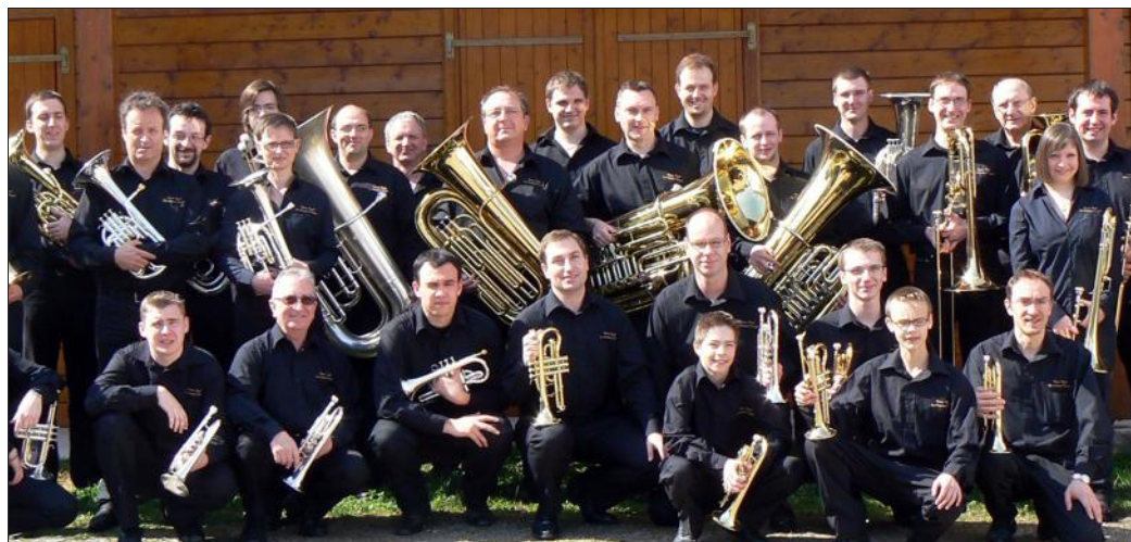
Le Brass Band des Hautes-Vosges donnera un concert dimanche dans la salle des fêtes de Hombourg-Haut, dans le cadre des 26e rencontres musicales de Hombourg-Haut.

Petite-Rosselle. Moselle-Sarre : Le charbon à l'origine de l'Europe ? . L'exposition retrace les rattachements successifs de la Moselle et de la Sarre et du gisement de charbon sarro-lorrain, depuis 1801 jusqu'en 1955. De 9h à 18h, jusqu'au samedi 31 octobre. Musée les mineurs Wendel. 8 €. 6 € pour les demandeurs d'emploi et les seniors, 4 € pour les étudiants/scolaires et les jeunes (- de 18 ans) et gratuit pour les enfants (- de 3 ans). Tél. 03 87 87 08 54.