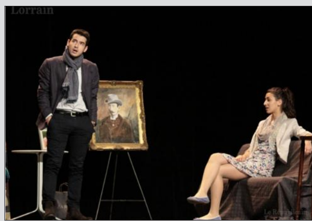
Une pièce du Théâtre de la Parole, ce samedi à la Médiathèque de Freyding.