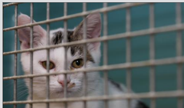
Durant tout le week-end, la SPA de Forbach organise des portes ouvertes "spécial chats".

La SPA de Forbach organise deux journées portes ouvertes exceptionnelles les 13 et 14 novembre, à destination des chats. Avec l'été qui a apporté son lot annuel de chatons et d'abandons, le refuge SPA de Forbach se retrouve avec beaucoup de chats qui ne trouvent malheureusement pas de famille.