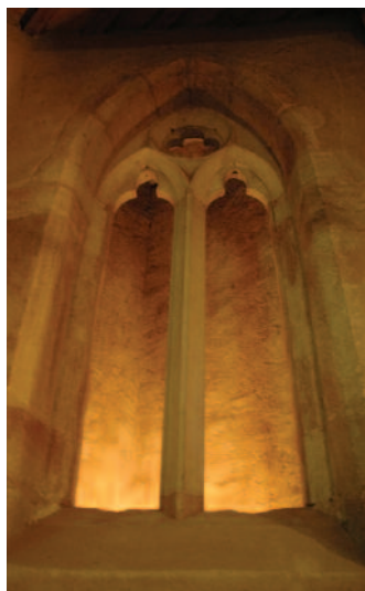
Chapelle Ste Croix

dont la frontière constitue un point de rencontre entre deux cultures. Nous suivrons les traces de la grande époque des Jacquets et du Moyen Âge en passant par monuments culturels, lieux idylliques et somptueux points de vue jusqu'à la petite ville médiévale de Hombourg-Haut puis vers Forbach.