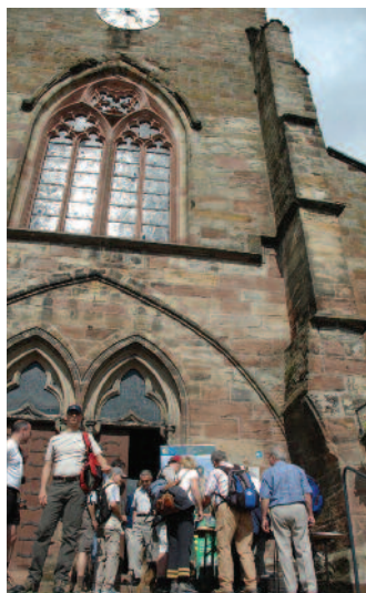
Collégiale St. Etienne