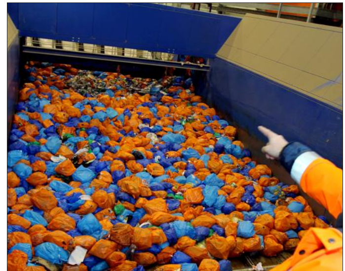
Les installations du Sydem génèrent un lourd déficit.

Textes : Emilie PERROT, Stéphane MAZZUCOTELLI et Pascal MITTELBERGER.