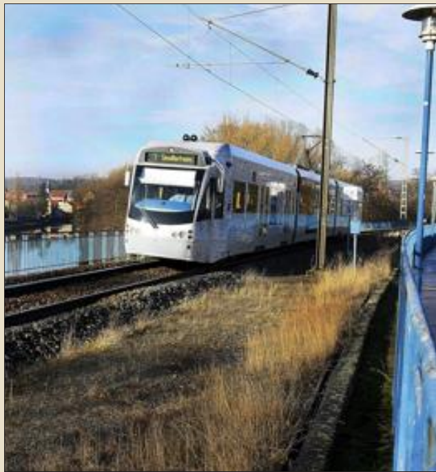
Le tram risque de ne plus circuler entre Sarreguemines et Sarrebruck si aucun accord n'est trouvé.

Les deux années de sursis accordées à la Saarbahn n'ont pas permis de trouver une solution. La société ferroviaire allemande doit s'acquitter de la redevance d'accès aux gares à compter du 1 er janvier. Ce, parce qu'elle utilise un tronçon français de 800 mètres, entre Sarreguemines et Sarrebruck. En réponse, l'opérateur menace de supprimer la liaison.