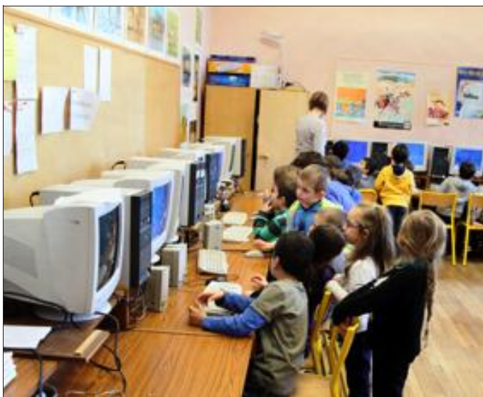
La majorité municipale prévoit d'investir 278 000 € dans l'amélioration des équipements informatiques dans les six groupes scolaires de Forbach.

Le temps du tableau noir est définitivement révolu. Nos enfants apprennent leurs leçons sur les tableaux numériques et des tablettes dernier cri. A Forbach, la majorité municipale a fait voter, lundi soir, une orientation forte dans ce domaine.