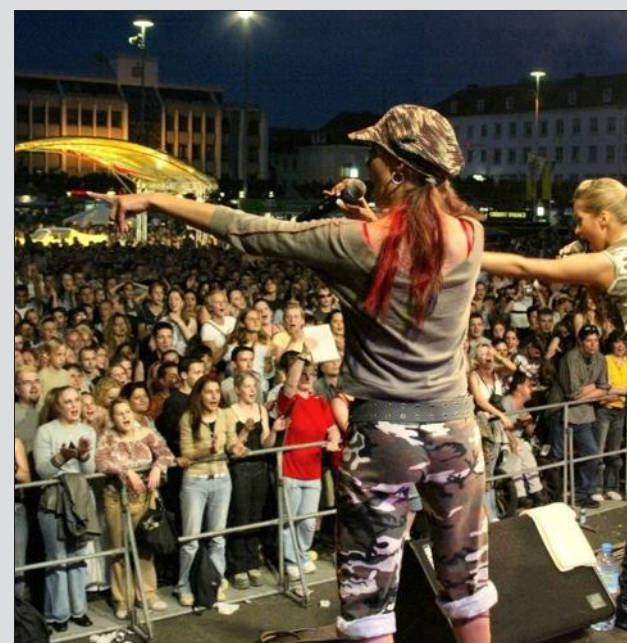
Le centre-ville livré pour trois jours à la musique et à la restauration.

Emmes, du jeudi 4 au samedi 6 juin, centre-ville de Sarrelouis. Programme détaillé : www.saarlouis.de