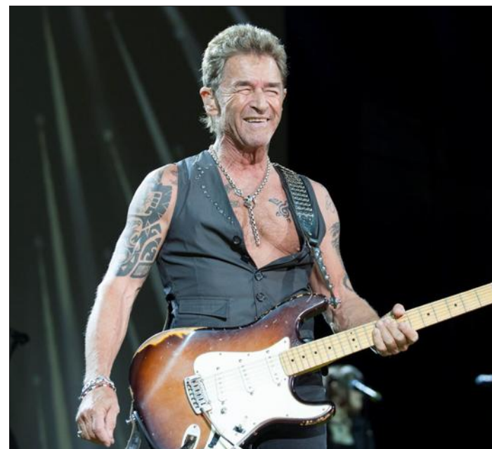
Seize albums en tête du hit-parade dans la longue carrière de Peter Maffay.

Originaire de Roumanie, ce chanteur-compositeur et guitariste a débuté sa carrière dans la chanson populaire avant de devenir l'un des porte-drapeau de la scène rock-pop allemande. Peter Maffay se produit avec son orchestre samedi au bord du lac de Losheim (nord de la Sarre) dans le cadre d'une grande tournée allemande en plein air.