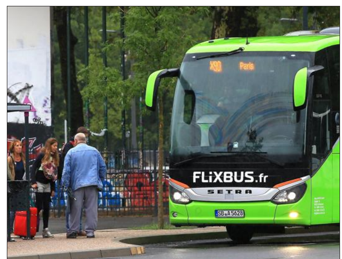
L'offre de Briam Socha et Flixbus vise à séduire les jeunes... et les seniors.