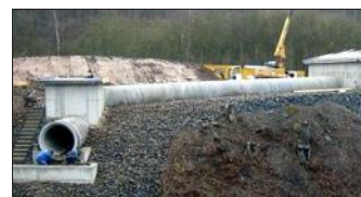
Un nouveau logis construit aux frais du contribuable pour des chauves-souris... qui n'en veulent pas.

Ah les ingrates ! Voilà qu'on a construit un abri tout neuf pour une colonie de 80 chauves-souris et que ces bestioles nocturnes n'en veulent pas. Coût : 440 000 euros ! Cette histoire qui fait rire jaune les Sarrois et la puissante association des contribuables d'Allemagne a pour cadre un pont autoroutier à Eppelborn, à 25 km au nord de Sarrebruck. L'édifice délabré, qui doit être détruit et remplacé, servait de logis à cette espèce de chauves-souris, protégée par une loi européenne. On a donc décidé de construire tout à côté, à flanc de coteau, un gros boyau en béton avec tout le confort nécessaire à ces mammifères volants. Mais ô déception ! Depuis plus d'un an maintenant, on attend toujours désespérément leur emménagement. Les chauves-souris dérangées dans leur quotidien ont, semble-t-il, préféré aller s'installer sous un autre pont, un peu plus loin.