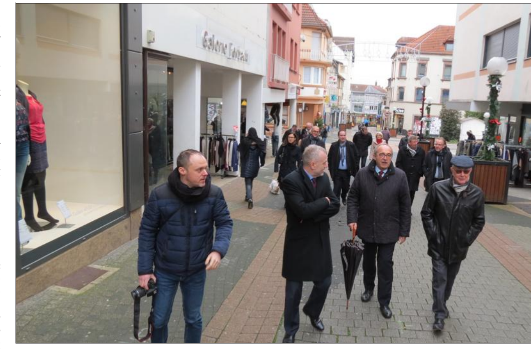
Les élus de Forbach lancent officiellement une étude pour redynamiser le centre-ville. Une première réunion a eu lieu ce mercredi avec les différents partenaires. Puis tout le monde a effectué une visite à pied de la zone piétonne, où des enseignes comme MS Mode sont menacées.

Cette étude sera pilotée par l'EPFL (établissement public foncier de Lorraine). Elle consistera à établir un diagnostic de la situation actuelle et devra formuler des propositions concrètes afin de rendre à nouveau attractif le centre de Forbach. Clairement, le but est de favoriser la réinstallation de commer-