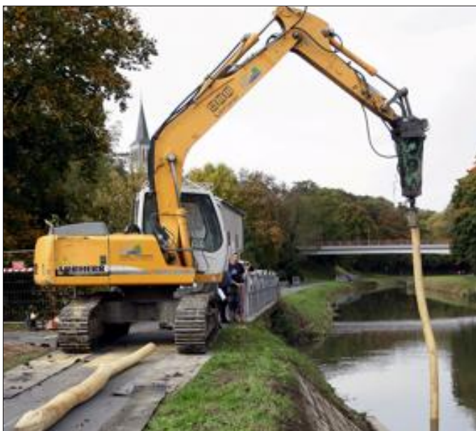
Les pieux qui soutiendront l'embarcadere de Grosliedersstroff ont été installés.

Chemins de promenade, embarcadere au bord de la Sarre, hall couvert, tyroliennes, terrain de beach-volley, jeux de dames géant : la zone de loisirs de Grosliedersstroff, en passe d'être terminée, sera un des plus abouties du secteur.