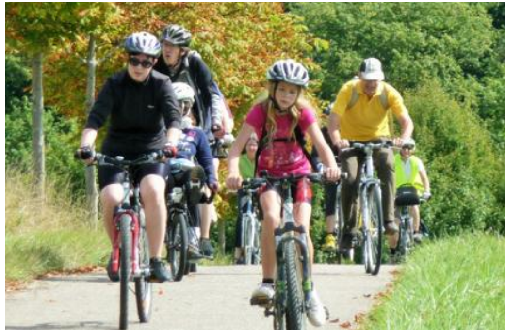
De nombreux parcours pour tous seront proposés aux amoureux de la petite reine.

Infos relatives aux circuits et programme : www.saarmoselle.org. Contact : Carolin. Guilmet-Fuchs@saarmoselle.org, +49 (0) 681 506-80 16.